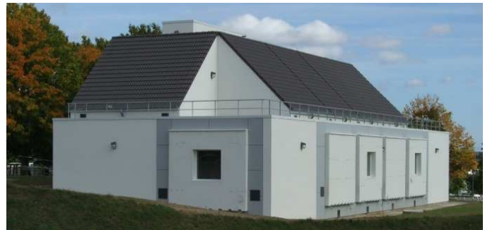
Le BestLab d'EDF pour les tests « Technologies solaires et Enveloppe du Bâtiment », site de recherche EDF des Renardières, également utilisé par le BHEE.

Le BHEE comptabilise 16 thèses de doctorat, notamment sur l'optimisation bioclimatique des bâtiments, la recherche de solutions solaires originales (froid, solaire, production électrique en complément d'un capteur thermique, enveloppes actives à base de photovoltaïque), l'optimisation de champs de capteurs géothermiques pour les pompes à chaleur, l'étude et le développement de nouveaux moyens de