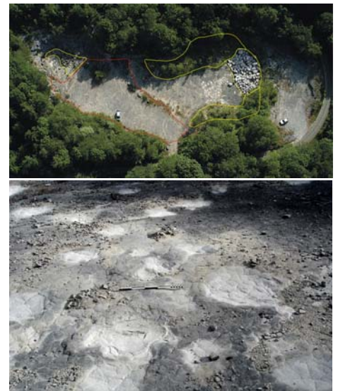
Traces de dinosaures, Loulle (39).

Cette découverte modifie quelque peu le modèle qui plaçait le Jura, à l'époque de l'Oxfordien supérieur, sous une mer peu profonde mais persistante. Il s'avère maintenant que quelques îlots plus ou moins temporaires créaient en ce temps-là un paysage lagunaire sensible aux oscillations du niveau marin.