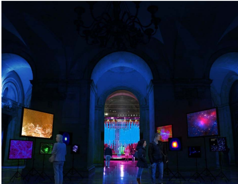
Modélisation d'une partie de l'atrium de l'Hôtel de ville de Lyon.

© CNRS, modélisation Alban Perret Studio