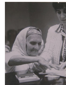
Collection Dahan-Hirsch Bruxelles.